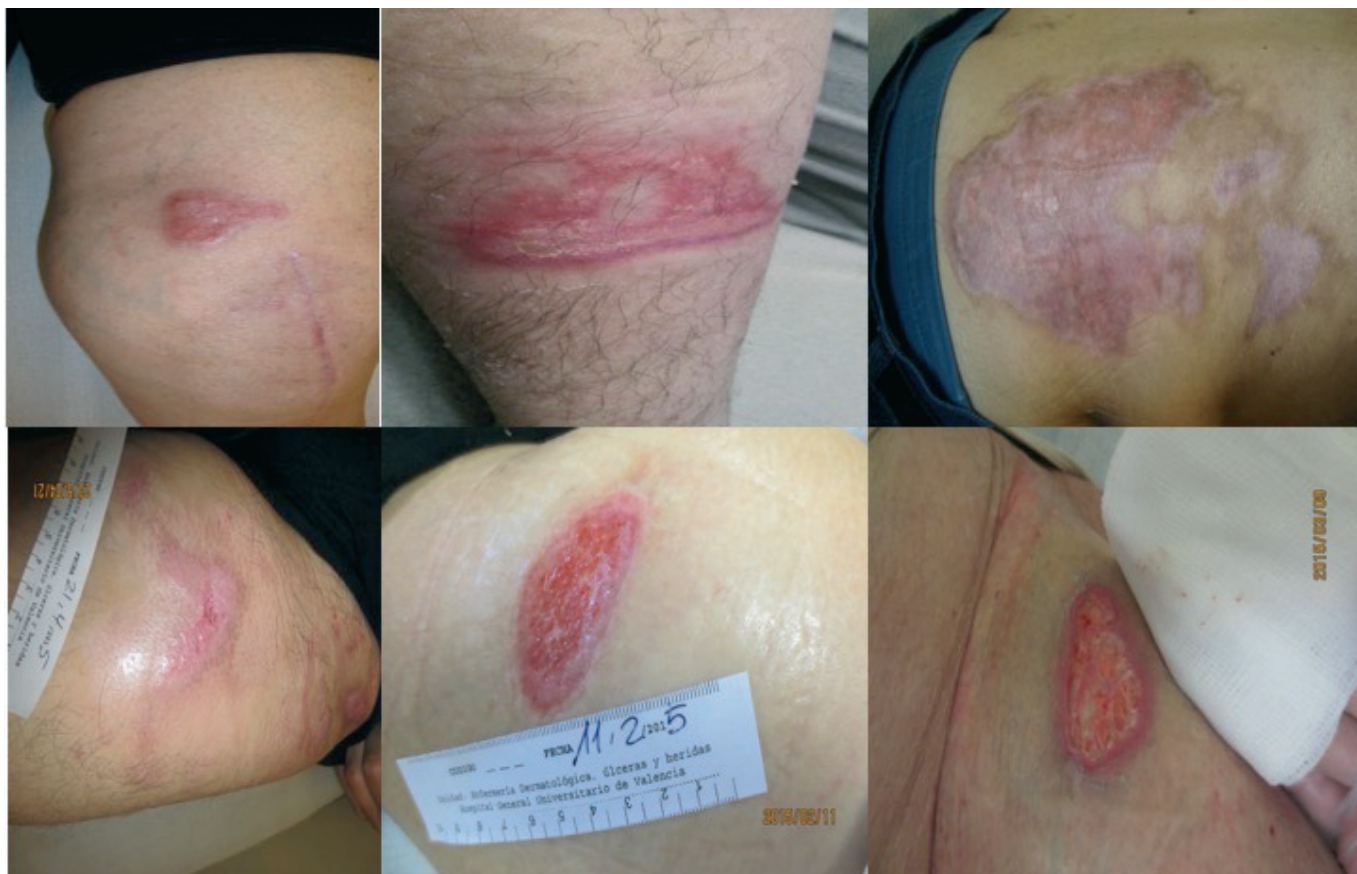
Imagen 5 - Aspecto de las cicatrices y tejido de granulación