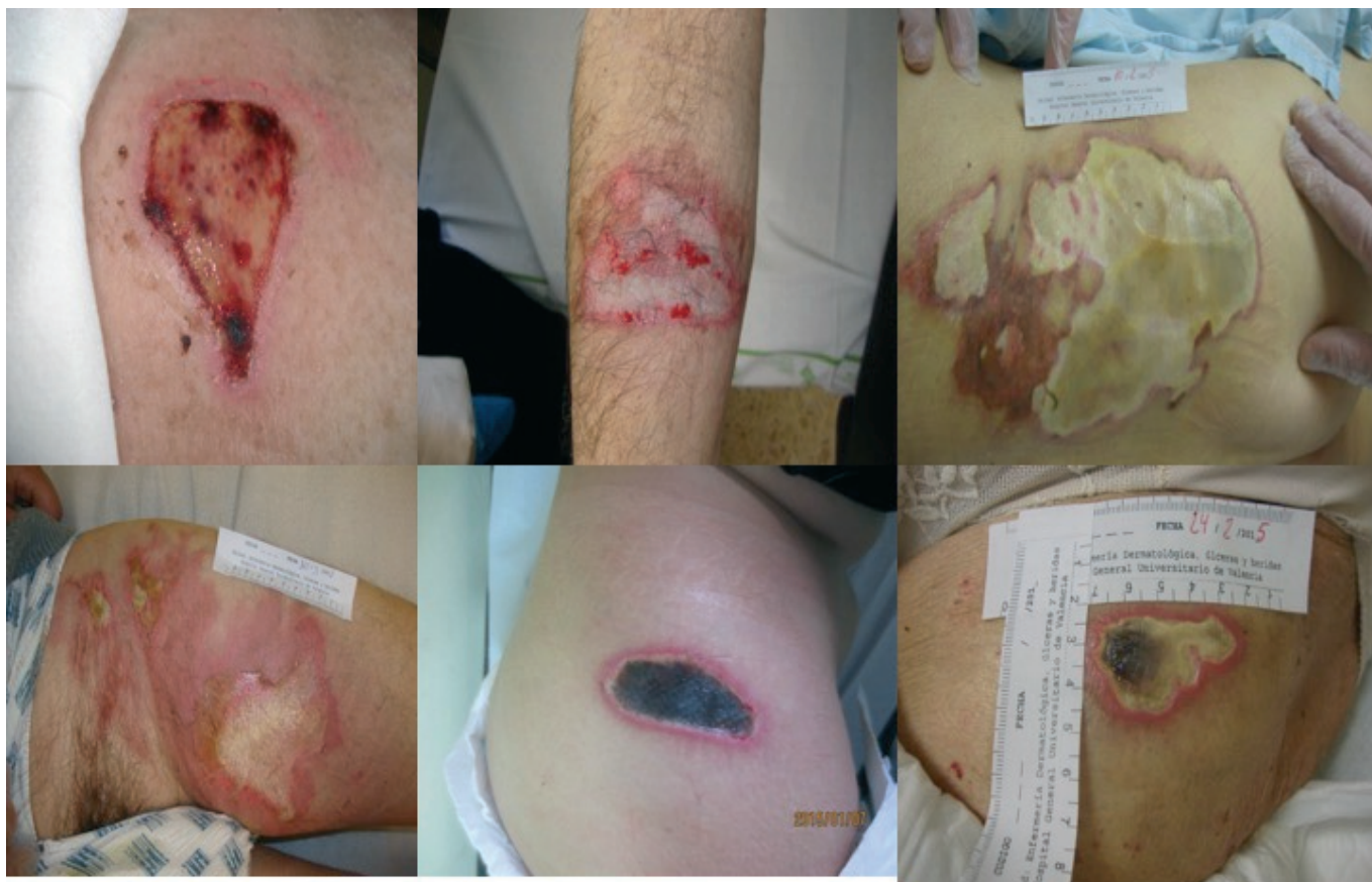
Imagen 2 - Necrosis al comienzo del tratamiento

El desbridamiento cortante fue realizado en todos los casos a partir de la 2ª cura cuando quedaba delimitado el tejido desvitalizado o necrosis.