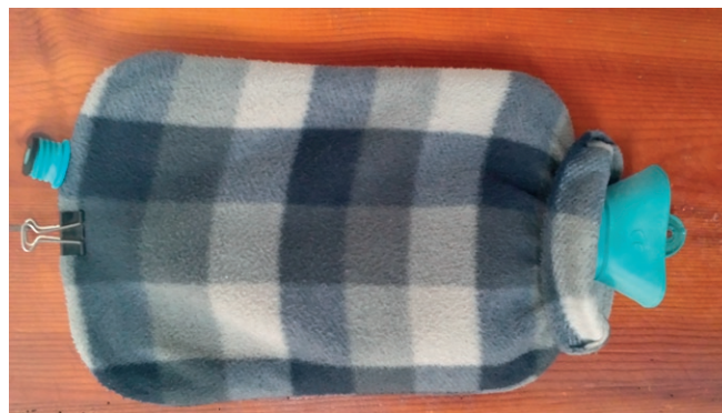
Imagen 3 - Principal causa de la quemadura contacto con bolsa de agua caliente

Para la prevención de secuelas, como la retracción del área quemada; así como, para evitar la sequedad cutánea, la aparición de erosiones y el prurito, una vez cicatrizada la lesión completamente, se informó a los pacientes de la necesidad de hidratación del nuevo epitelio mediante el uso de Ácidos Grasos Hiperoxigenados (AGHO) prescritos, masajeando la zona para facilitar la penetración y una absorción del producto. También se recomendó el uso de fotoprotectores solares para las lesiones en áreas fotoexpuestas (Imagen 5).