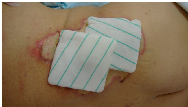
Imagen 4 - Apósito de Tenderwet® sobre necrosis