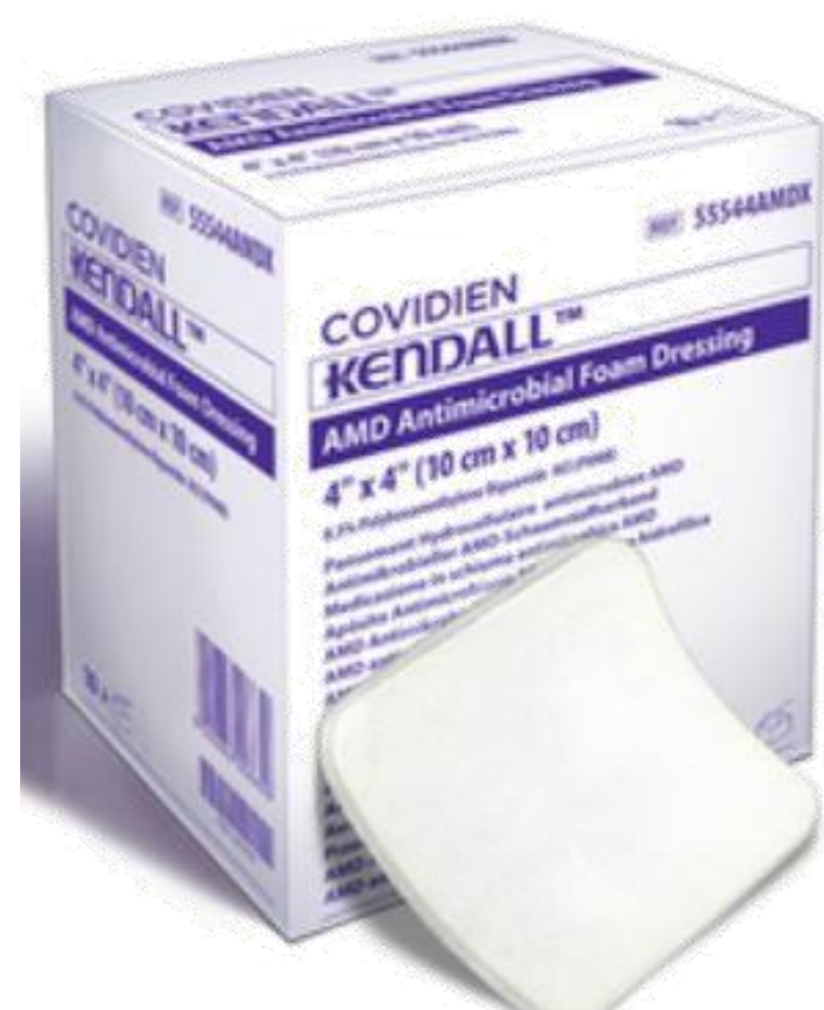
Apósito polimérico + PHMB 0,2%