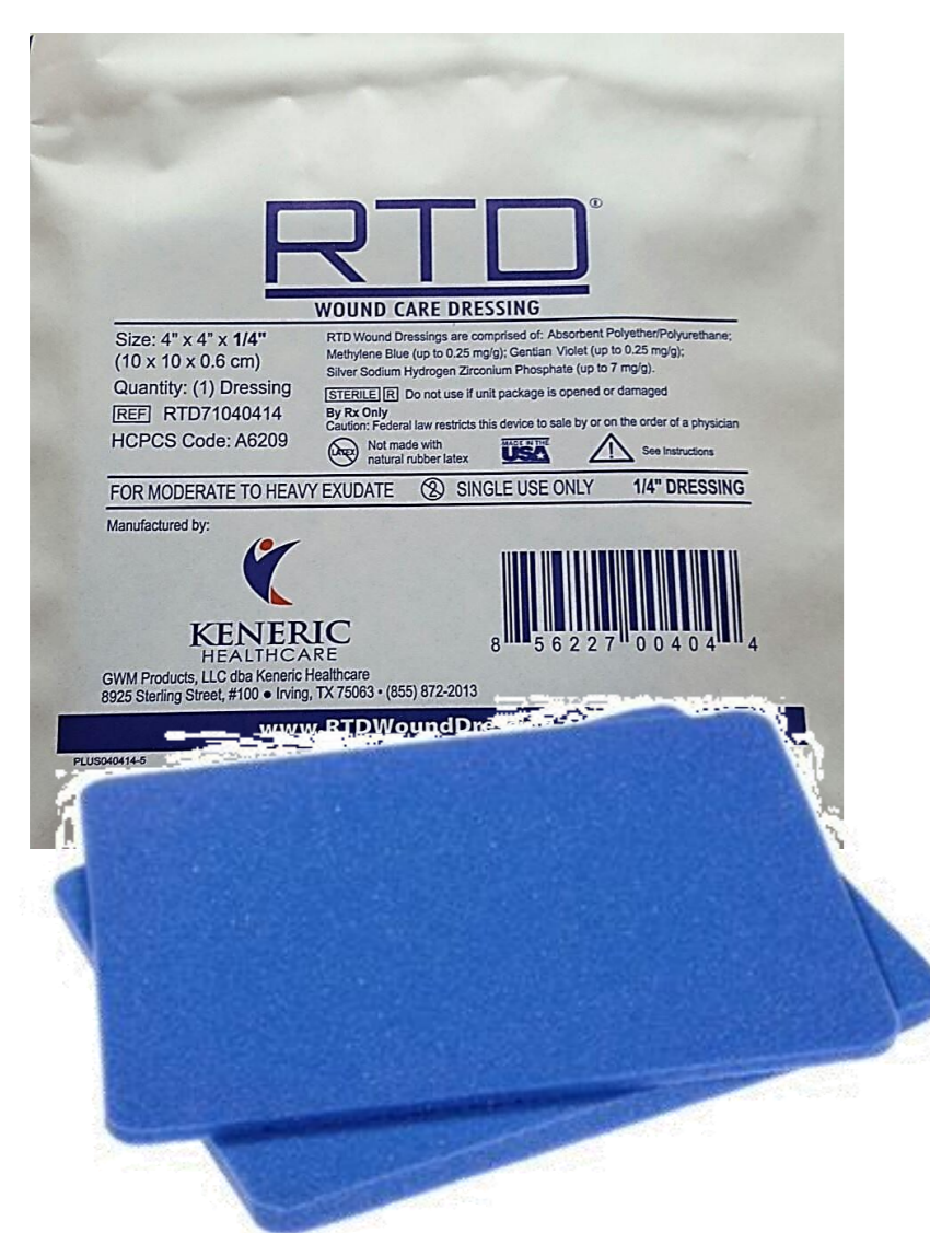
Apósito de espuma con plata iónica+ azul de metileno + violeta de genciana