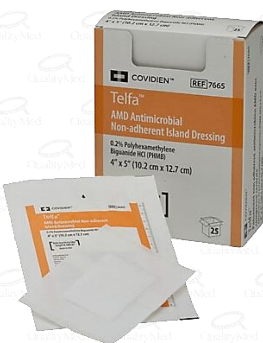
Apósito de alginato + PHMB 0,2%