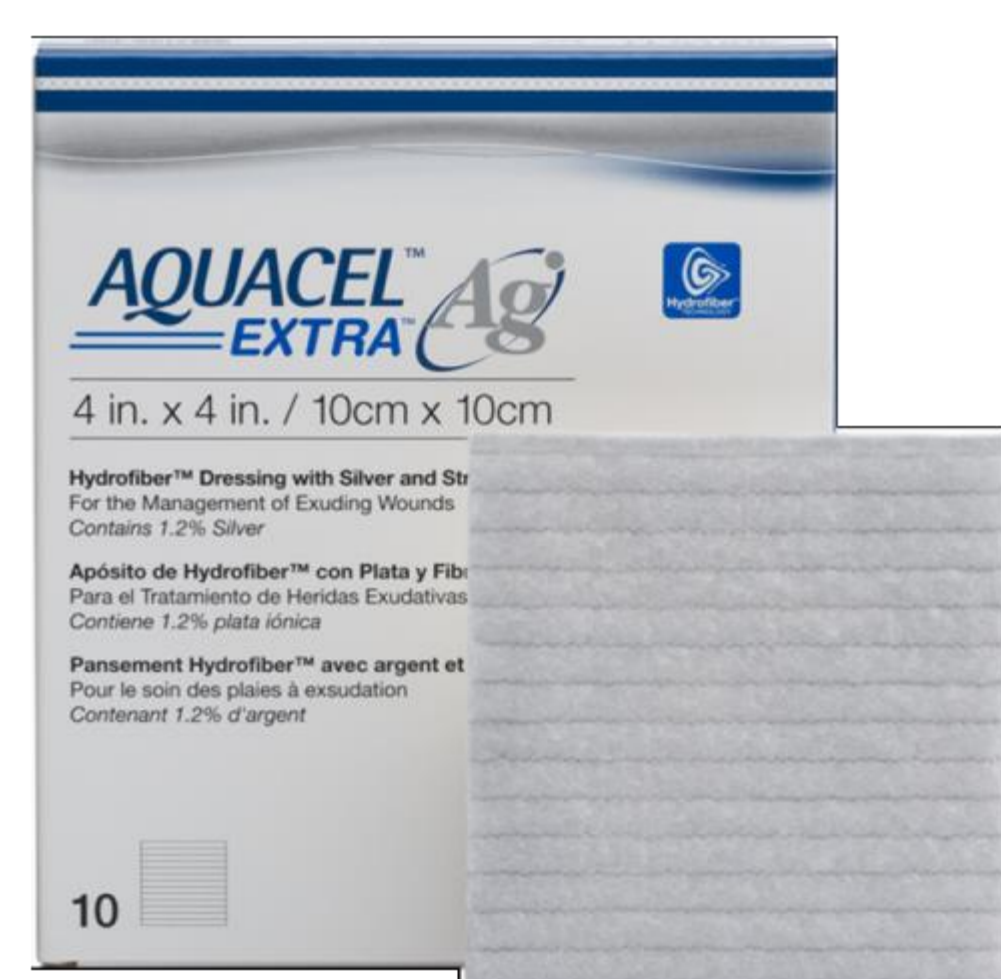
Apósito de Ag+ iónica con hidrofibra

Conclusiones: Existen nuevos avances de apósitos antimicrobianos que son biocidas para la mayoría de microorganismos presentes en las heridas crónicas y, menos nocivos para el tratamiento de heridas. A falta de evidencias concluyentes, se presupone que dichos apósitos antimicrobianos cumplen con todos los estándares clínicos deseables: intervienen en el estado de colonización crítica de una herida, son de amplio espectro contra microorganismos, incluyendo los resistentes; de acción rápida, pero de actividad sostenida; no irritantes y no citotóxicos; fácilmente solubles; sin que presenten inactivación a fluidos orgánicos, exudado de heridas y biopelículas; y se consideran costo-efectivos.