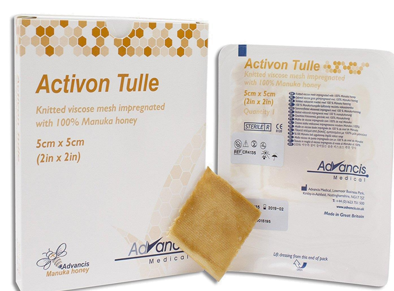
Apósito de miel de Manuka (metilglioxol)