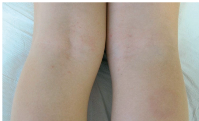
Imagen 1 - Aspecto de las lesiones sobre los huecos poplíteos.

Dado que el molusco contagioso constituye un proceso autolimitado, en ocasiones se tiende a la abstención terapéutica. Sin embargo, es conveniente señalar que la resolución espontánea puede tardar años facilitando el contagio y la po-