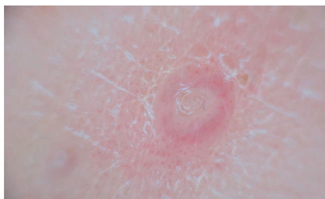
Imagen 2 - Imagen dermatoscópica.